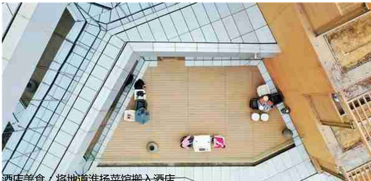
酒店美食：将地道淮扬菜馆搬入酒店

酒店建在这西峪水库边的山坳中，三面环山，背山面水。幽静、安逸的生态环境形成了空间独特的气质，沿着U型坡地的两翼做出了台地型客房，所以露台的视角便有了特点。