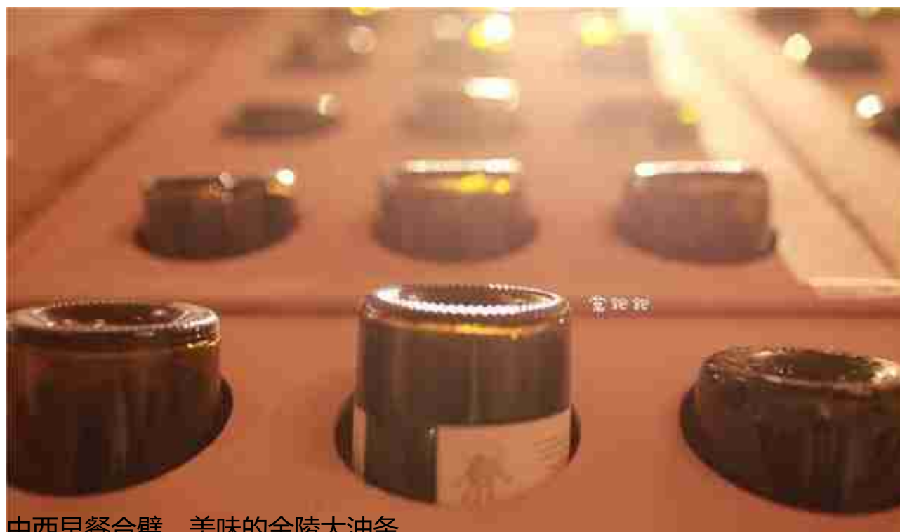
中西早餐合璧，美味的金陵大油条

而在北京这地界，中信金陵酒店的淮扬菜可是出了名的地道，不少人专程过来吃这素有“东南第一佳味，天下之至美”的美味。而这地道的美味，则是出自于手艺精湛的大厨，他们可都是从淮扬一代专门聘请的。