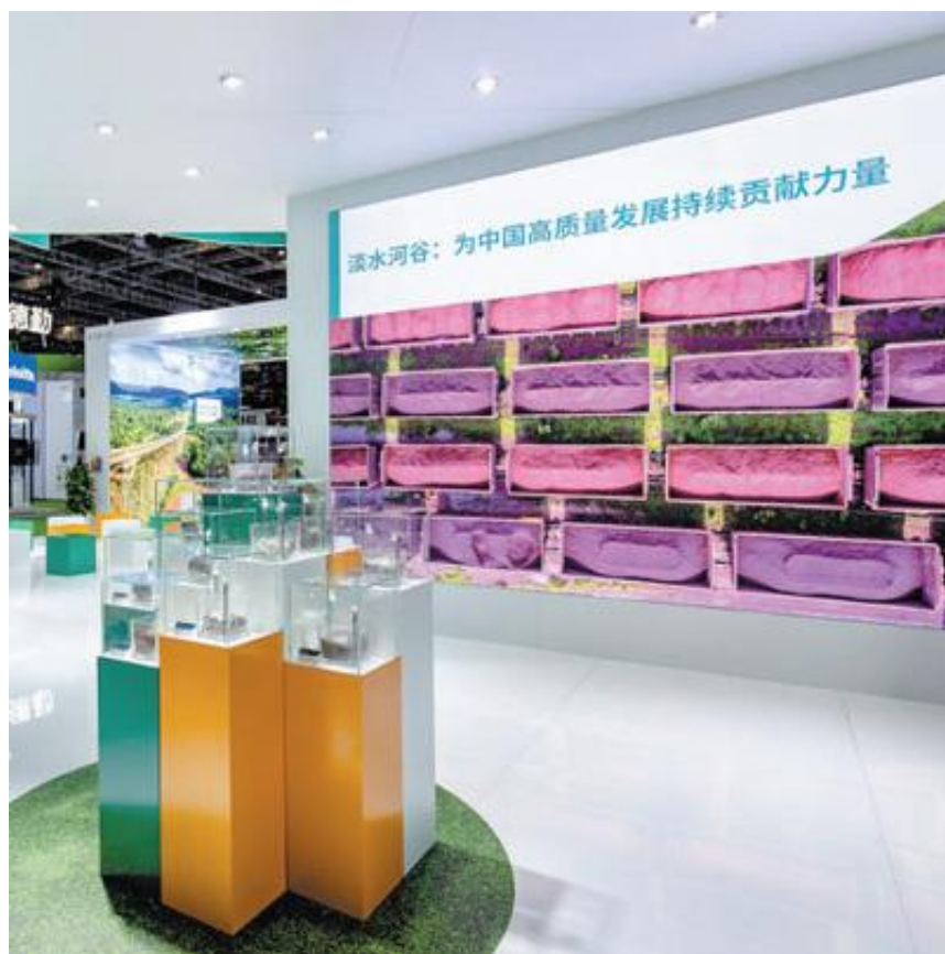
2022年11月，淡水河谷连续第五年参展进博会，展示绿色创新技术、产品和服务。