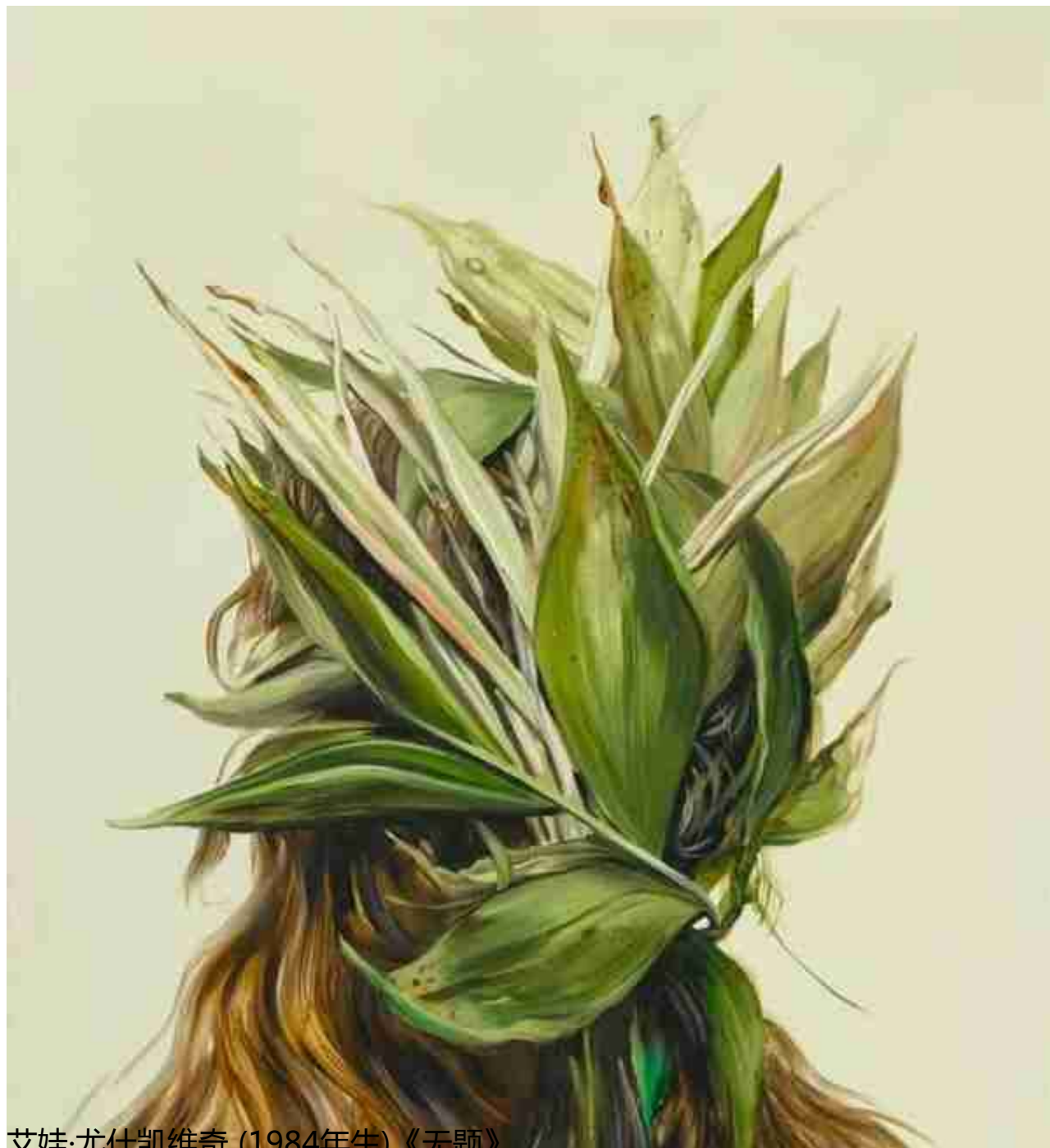
艾娃·尤什凯维奇 (1984年生) 《无题》