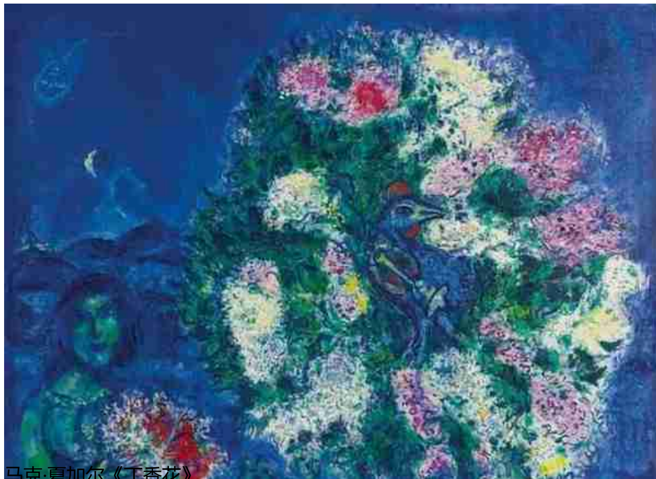
马克·夏加尔《丁香花》