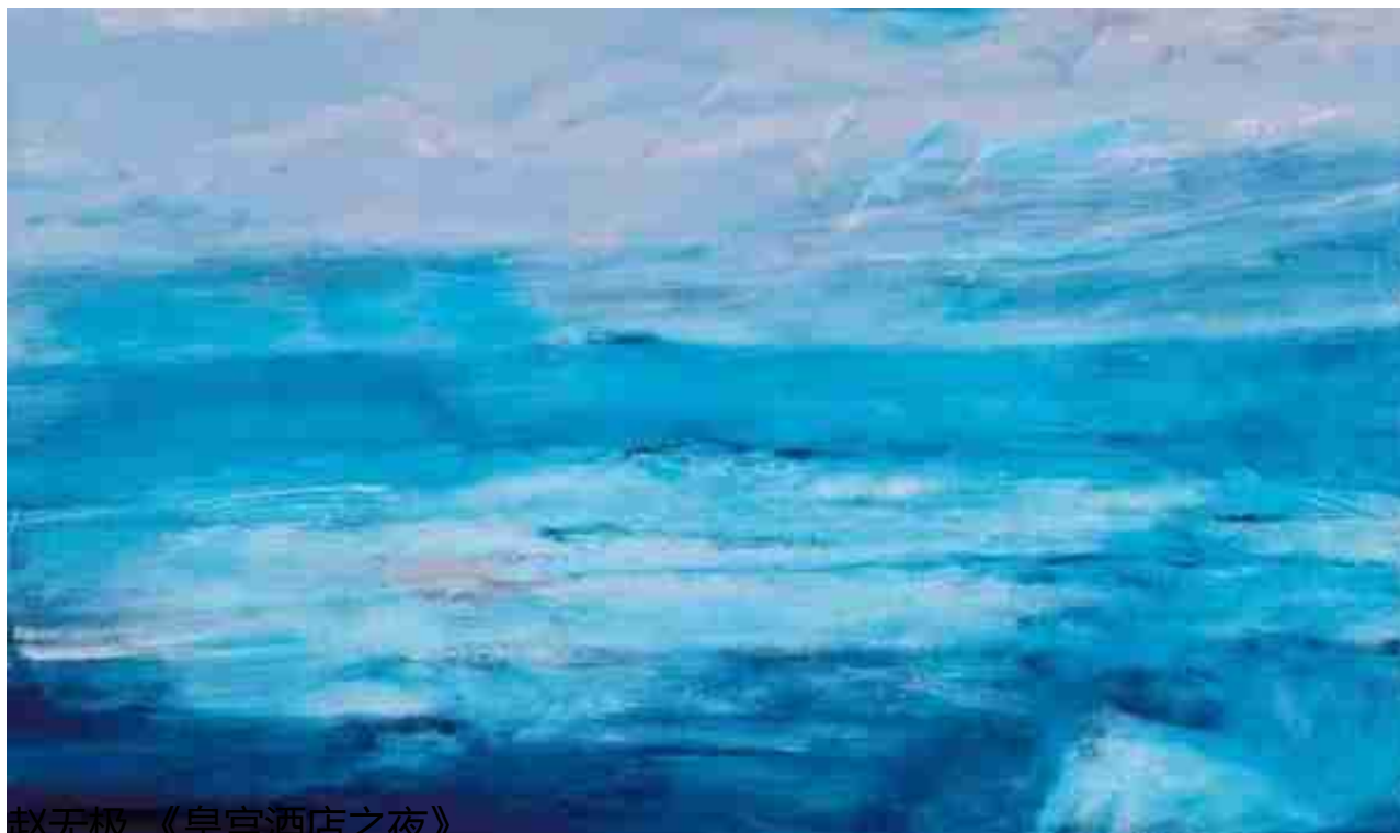
赵无极《皇宫酒店之夜》