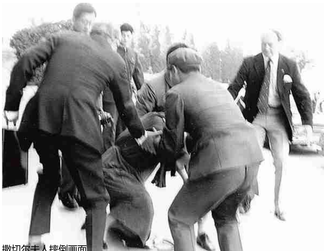
撒切尔夫人摔倒画面

撒切尔夫人一听，气焰瞬间灭了大半，脸色骤变。她自己也心知肚明，早在50年代初，中国还百废待兴、一穷二白之时，中国军队就以一己之力重创了以美国为首的联合国军，战斗力之强无疑令人望而生畏。更何况如今的中国，已经是坐拥两弹一星的核大国了，军事实力跟好欺负的阿根廷可不是一个等级。