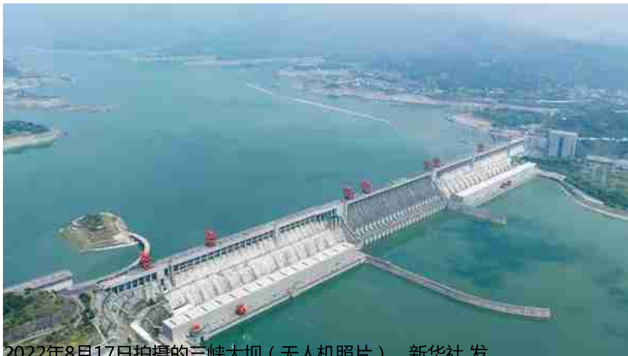
2022年8月17日拍摄的三峡大坝（无人机照片）。

18日，记者从水利部长江水利委员会获悉，三峡水库已于16日12时向长江中下游持续补水调度，可使汉口、沙市、城陵矶、湖口站水位较不补水情况下抬高0.1至0.4米。