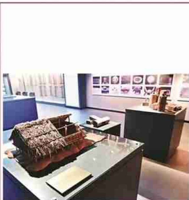
河姆渡遗址干栏式建筑模型。