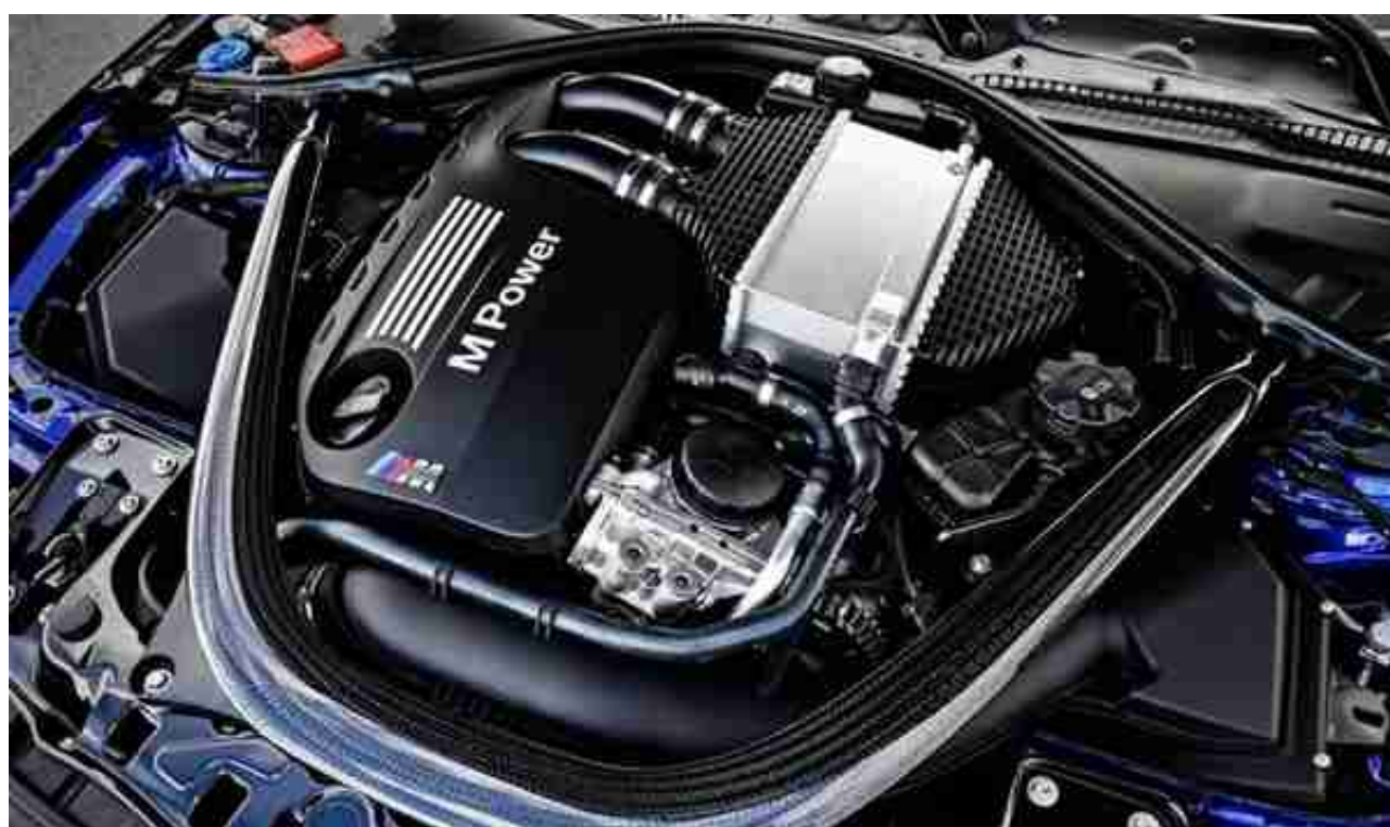
(图：内饰与发动机细节)

到了2018年的时候，还又推出了限量1200台的M3 CS，而且这车的调教还比M4