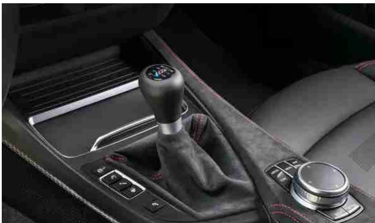
(图：久违的手动挡出现在M2 CS上了)