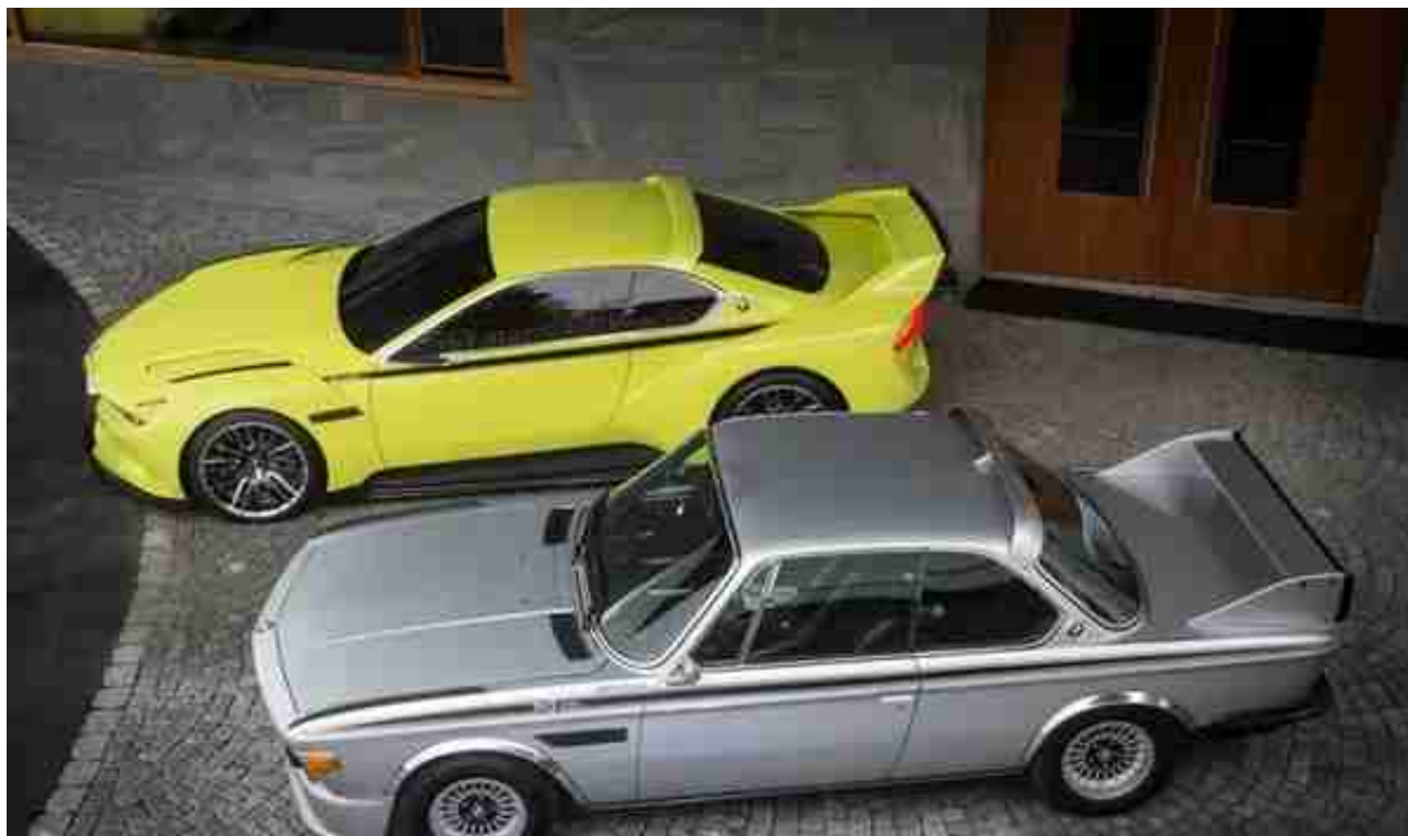
(图：致敬1975年的3.0 CSL Hommage概念车，向左滑动查看更多图片)