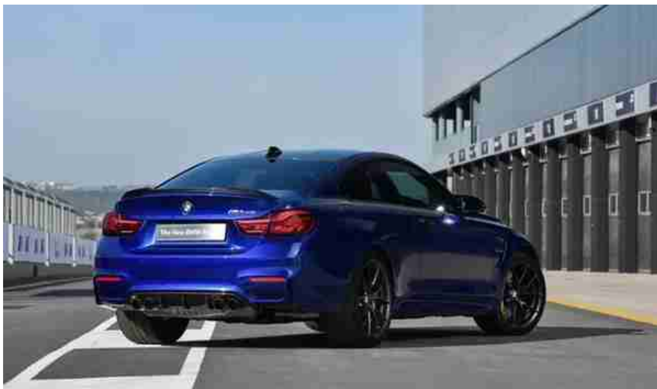
( 图 : M4 CS )

至于离咱们最近的，能够买得到的宝马CS系列就是2017年的宝马M4 CS，453匹和600牛米的数据比普通版M4性能稍微有所增强，但更多的是轻量化碳纤材料的使用，并且只有深蓝色一种。