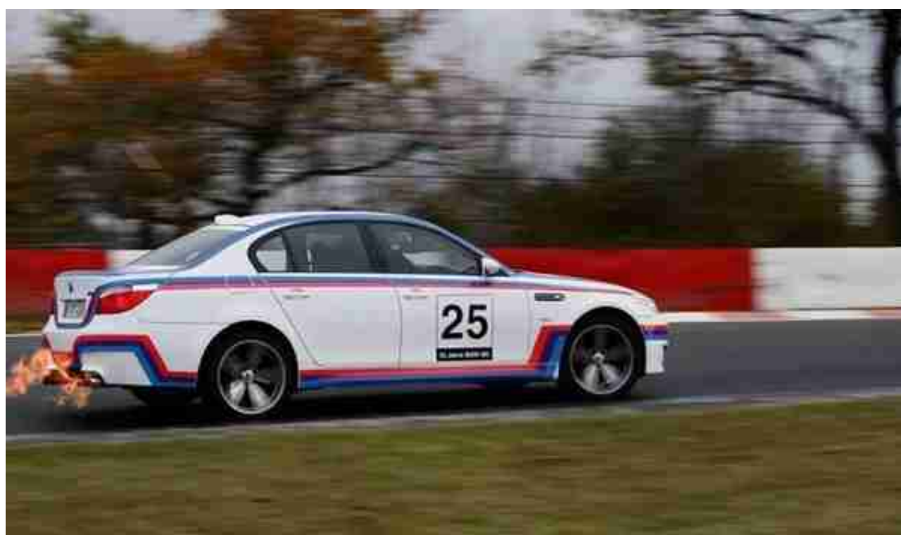
(图：E60 M5 CSL概念车，背景为正在跑纽北赛道，向左滑动查看更多图片)