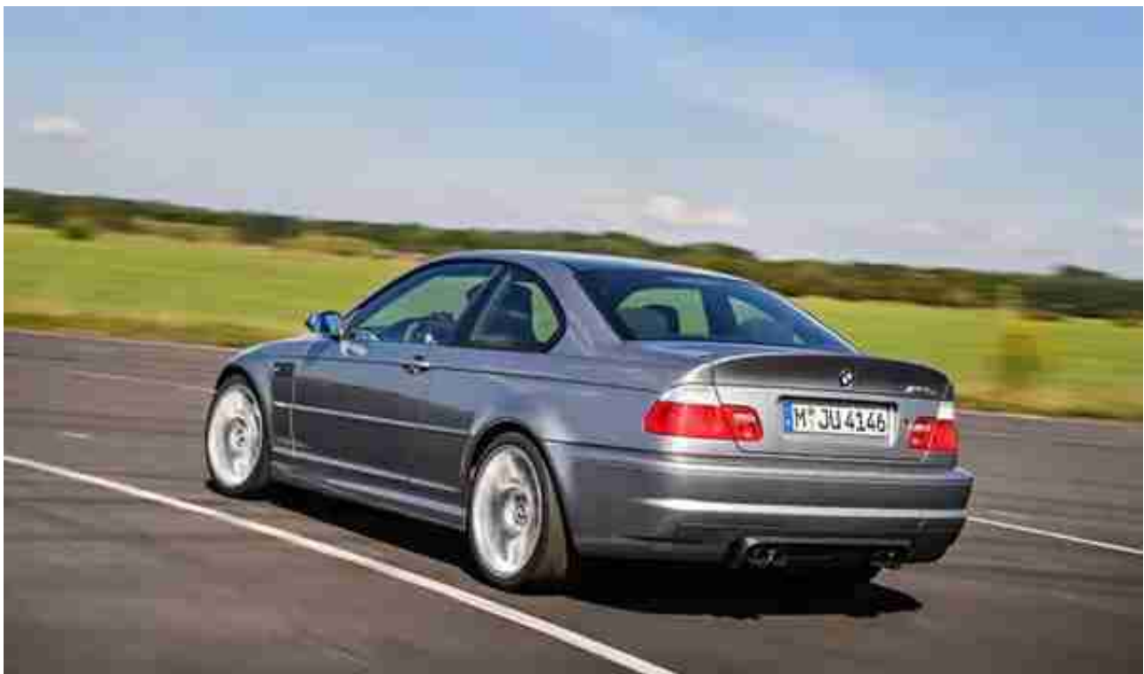
( 图 : 宝马 E46 M3 CSL , 前保险杠的窟窿是为了致敬3.0 CSL , 向左滑动查看更多图片 )