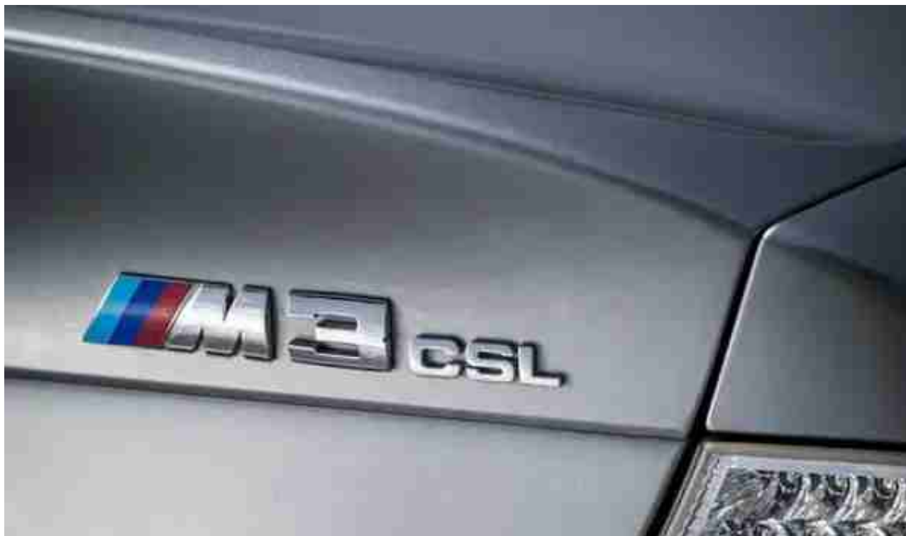
(图:宝马 E46 M3 CSL)

都说“人生中有台绕不过去的三系”，意思就是说爱玩车的人肯定会选择一台宝马三系，也正是从E46三系这代开始，宝马车的性能开始得到全世界广泛认可。当年电子游戏《极品飞车9》里面那台蓝白拉花的E46 M3，也为这台车的文化影响力再送一程。