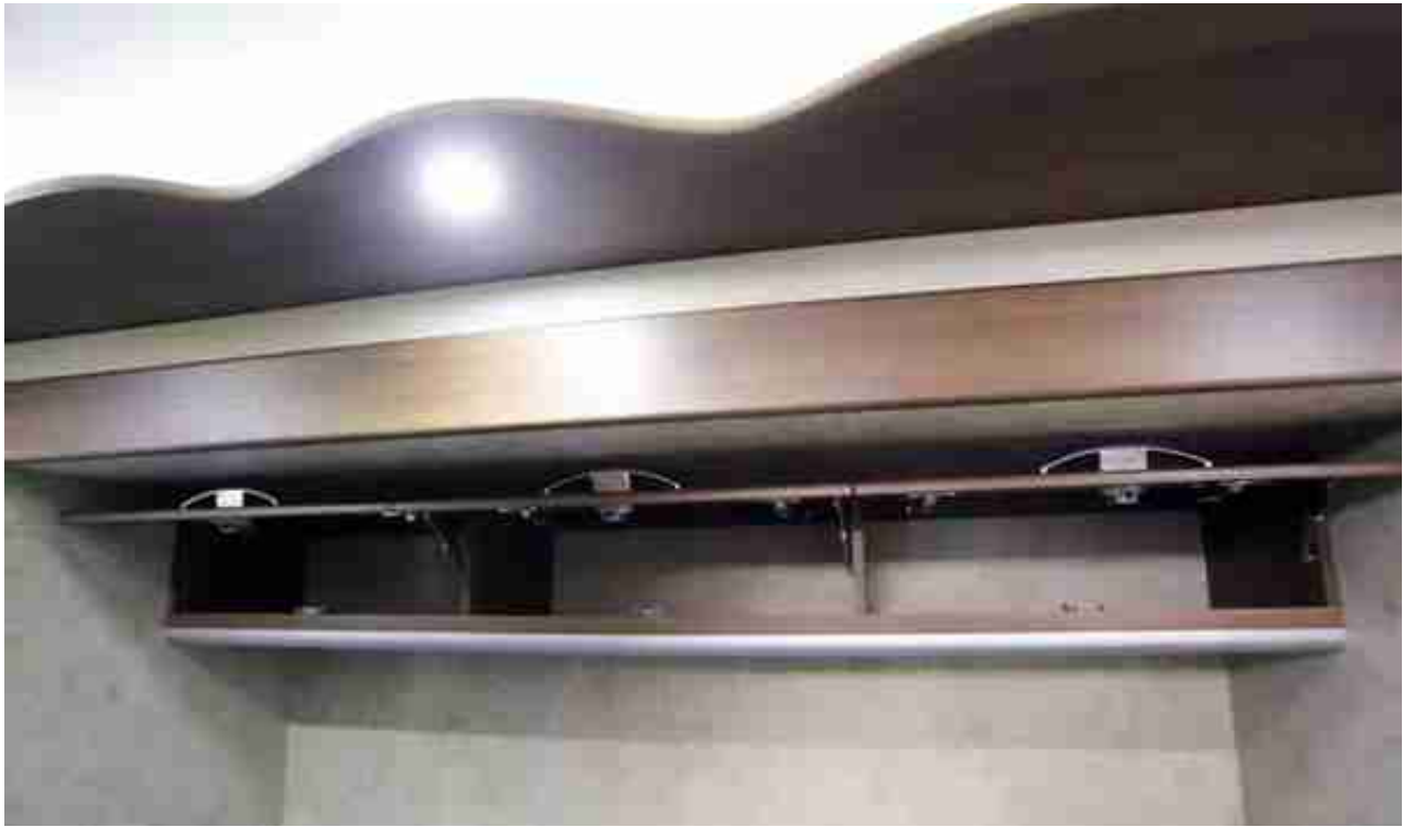
顶置储物柜空间展示