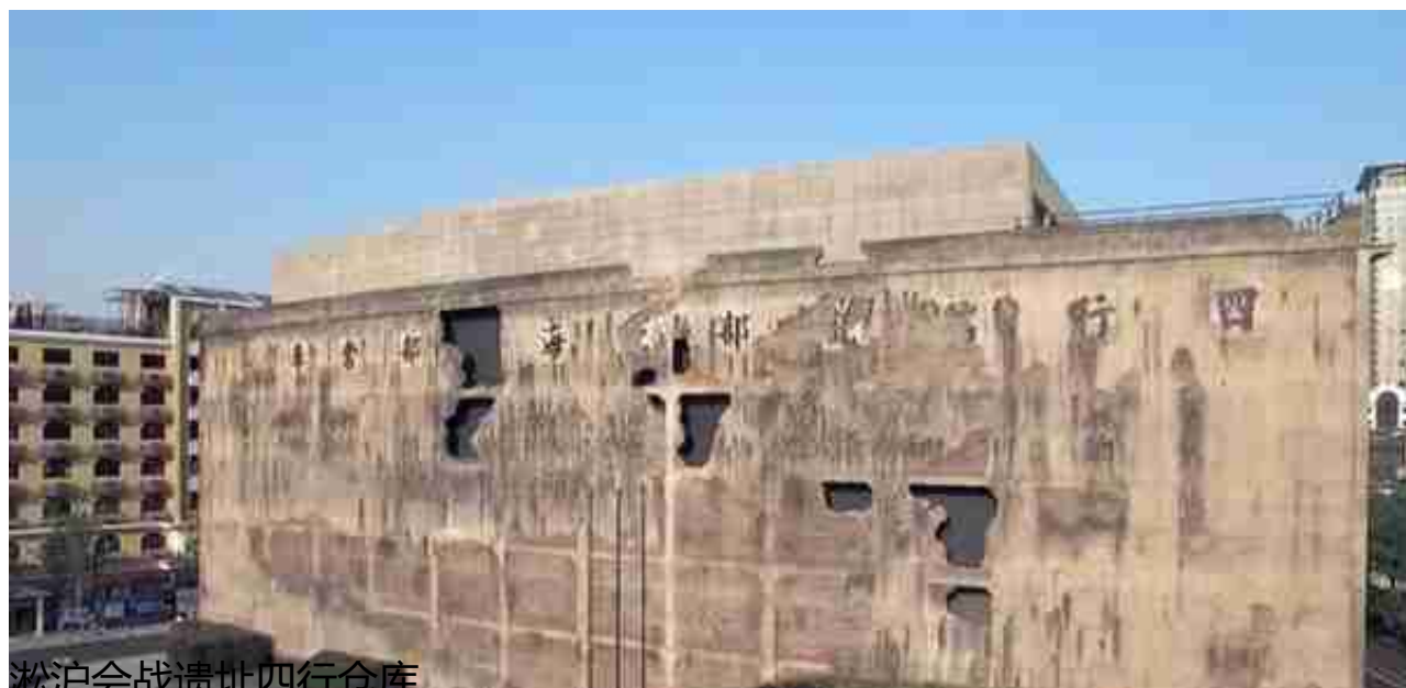
淞沪会战遗址四行仓库

今天的上海是中国第一大城市，正加快建设成为卓越的全球城市和具有世界影响力的社会主义现代化国际大都市。自19世纪中叶以来，西学东渐，江南文化、海派文化、红色文化在这里汇流。要理解上海何以成为今天的上海，需要一次全方位的历史回眸。