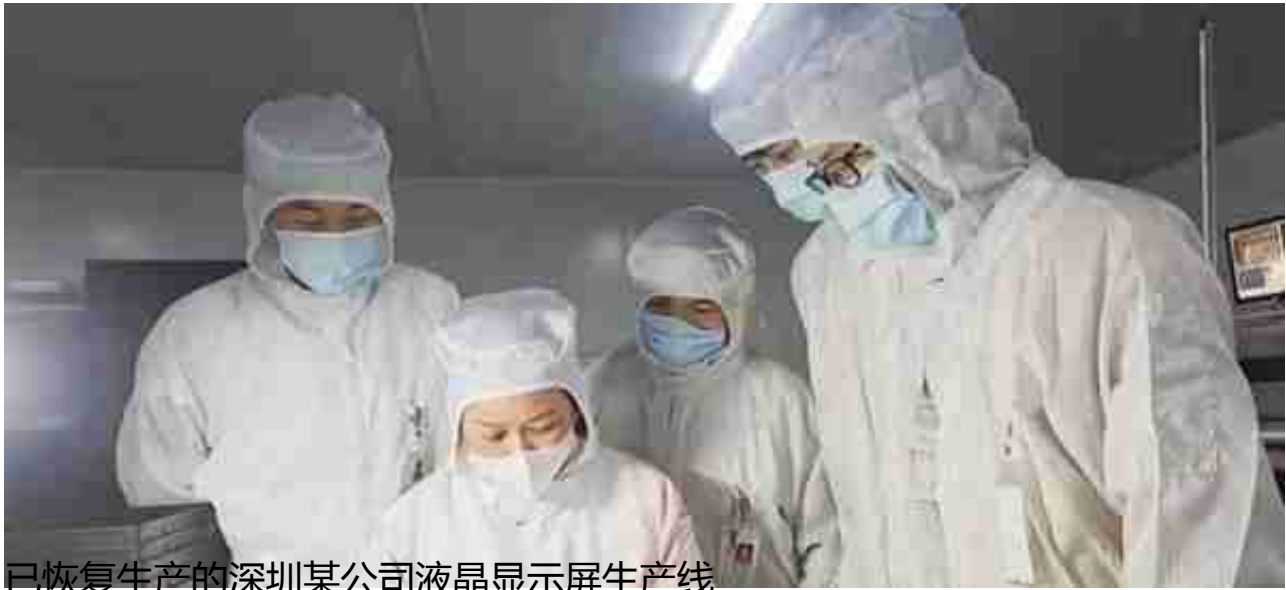
已恢复生产的深圳某公司液晶显示屏生产线

深圳分行正大力推进“专精特新”服务小组各项服务工作，根据“专精特新”企业自身经营发展所处阶段及行业地位，形成分阶段、分层次、立体式服务体系，充分运用高新技术信用贷、银税通、信用增值贷、龙商贷、房贷通等一系列拳头产品，全面满足企业结算、融资等方面需求，全速支持科创类中小企业高质量发展。