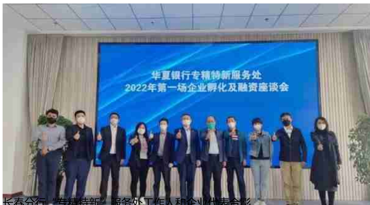
长春分行“专精特新”服务处工作人员和企业代表合影

该企业是吉林省级“专精特新”企业，受前段时间疫情影响，该公司的生产经营和回款节奏，物流配送、订单履行等出现阶段性困难。为确保企业能够保障供应链稳定和及时复工复产，华夏银行长春分行在了解到该企业困难后，立即组建专业服务团队，经过多方协调，克服困难，简化审批流程，缩短审批链条，仅用2天时间实现贷款的迅速投放。