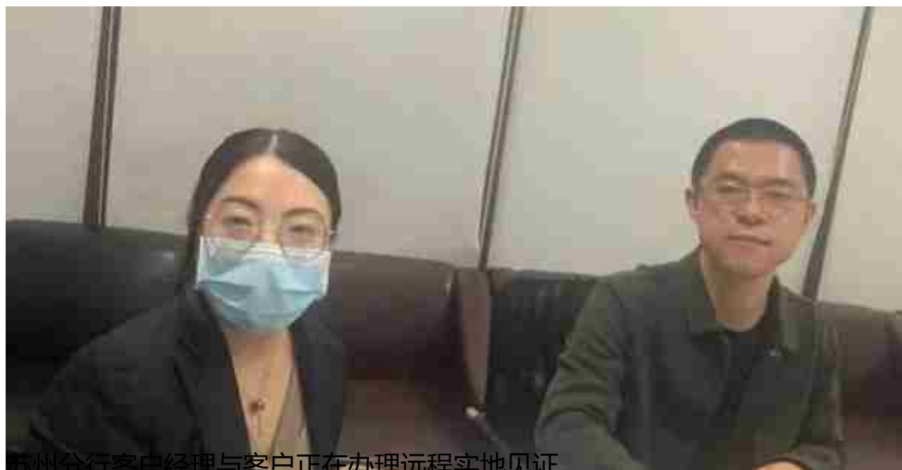
苏州分行客户经理与客户正在办理远程实地见证

面对更多企业遇到的困局，苏州分行与企业心手相连，第一时间出台惠民助企“九项措施”，逐户研究纾困解难措施。