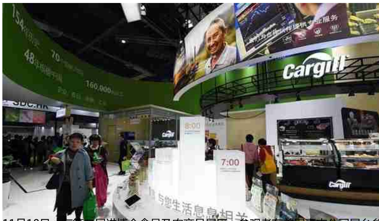
11月10日，在第二届进博会食品及农产品展区，参观者在美国嘉吉公司展台参观。

“使用关税武器和丛林法则，解决不了当前世界面临的问题，这不是法国的选择，也不是欧洲的选择。”法国总统马克龙道出了与会各国政要的共识。