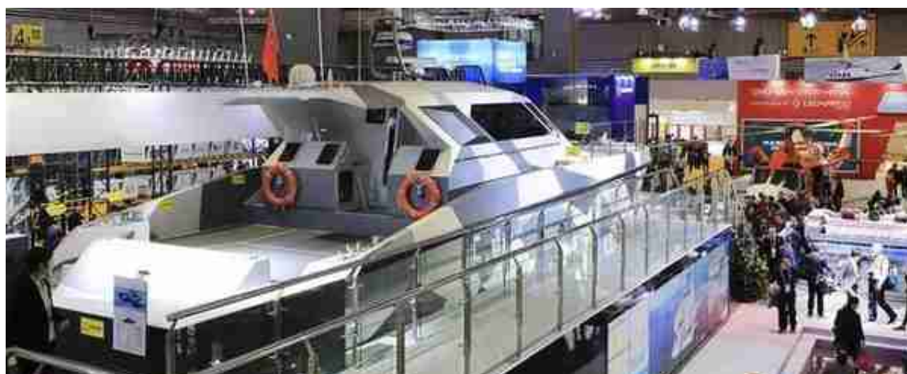
这是在第二届进博会装备展区拍摄的法拉帝公司的FSD 195高速公务巡逻船（11月

此刻，习近平主席两年多前的话，更加含意深远。多彩的秋天，丰硕的果实，这是中国的机遇，也是世界的机遇。