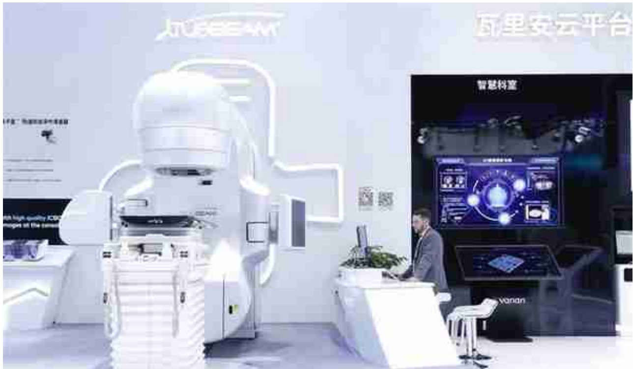
工作人员在第二届进博会医疗器械及医药保健展区瓦里安展台查看设备(11月5日摄)。