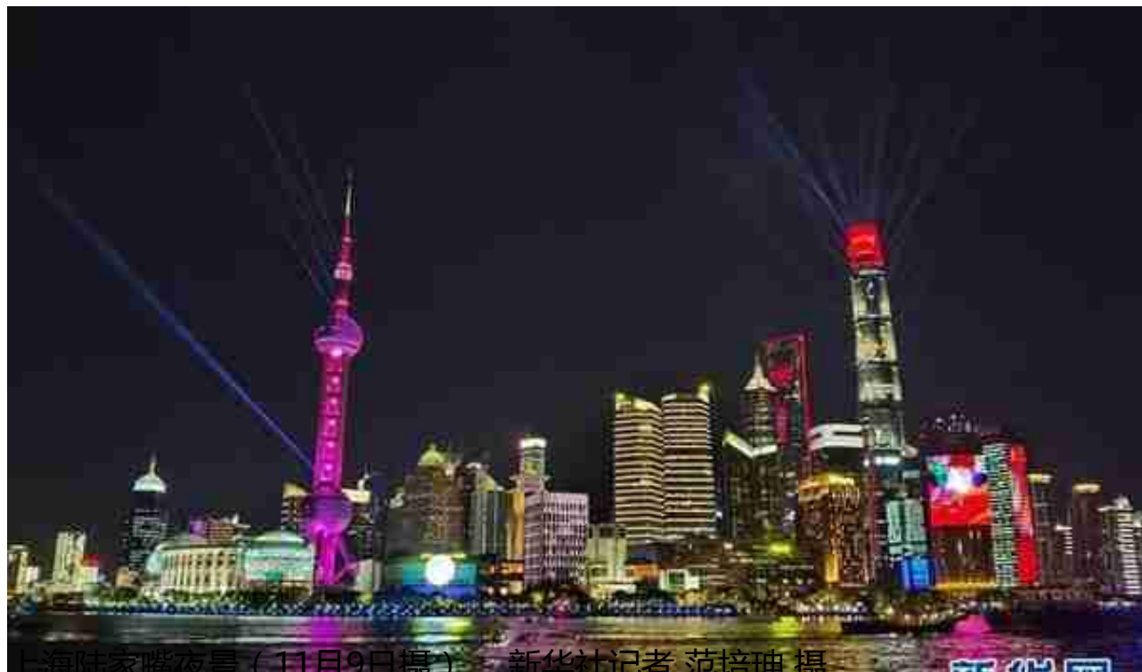
上海陆家嘴夜景（11月9日摄）。