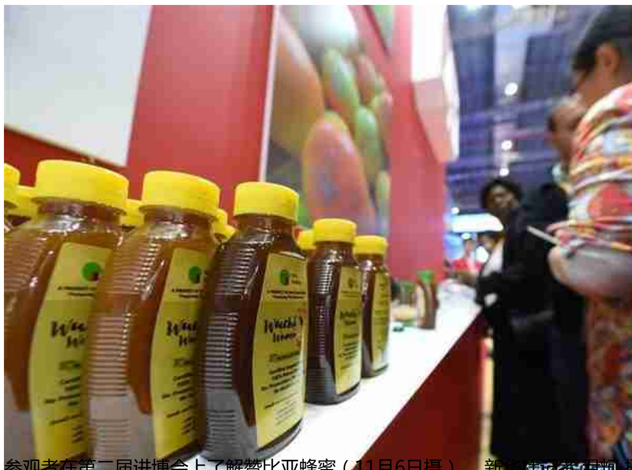
参观者在第二届进博会上了解赞比亚蜂蜜（11月6日摄）。

各类展会轮番登场，是“欢迎大家都来看看”的最新注脚，更是对“必然更加光明”的中国经济投下信心票。