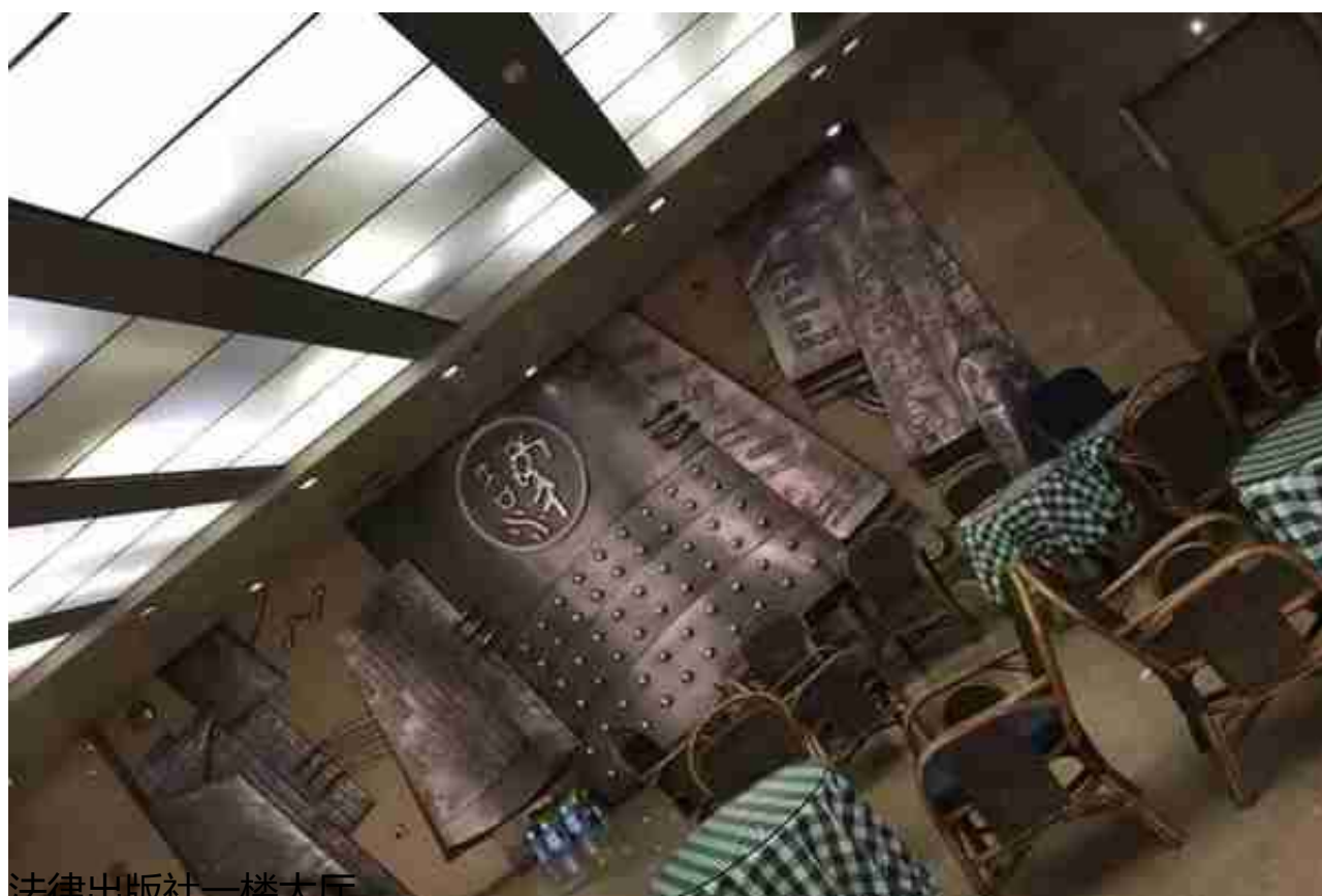
法律出版社一楼大厅

不过营销做久了，大抵也变得更会讲故事了。闲时有空，不妨看看我这则故事中，能否让您有一丝共鸣吧。