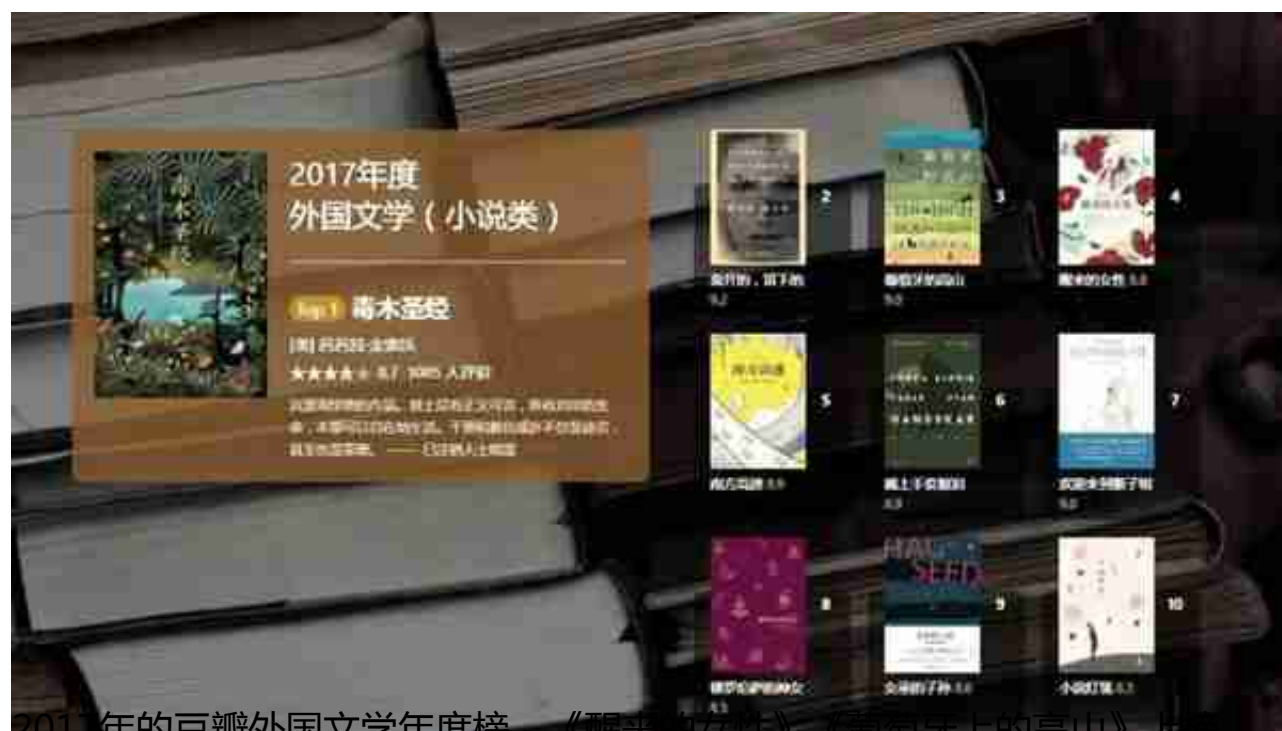
2017年的豆瓣外国文学年度榜，《醒来的女性》《葡萄身上的高山》上榜

《醒来的女性》一书以20世纪30年代一代美国女性的生存境遇向今天的我们发问，那些生活中的不公，那些让你会在“母亲”和“妻子”这两种身份中迷失的遭遇，对我们的意义究竟是什么？在数次登陆新京报书评周刊、做书、有书等媒体进行宣发之后形成了大范围的讨论。